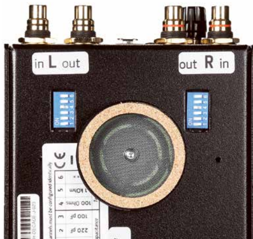
Einstellmöglichkeiten für MM-/MC-Systeme kanalgetrennt; hochwertige Dämpfungfüße